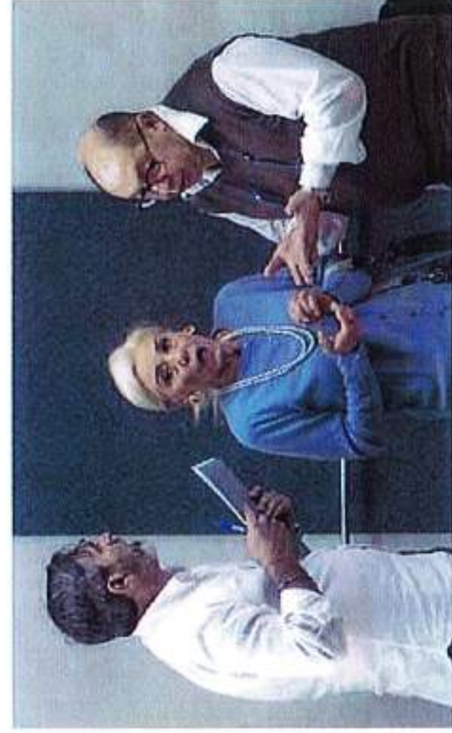
• In scena al Coseri la commedia «Alla ricerca di Eveline»

Venerdì, dopo domani, con inizio alle 20.30 sarà il turno del Gruppo teatrale "La cricca Aps" di Taranto, che proporrà la commedia dal titolo "Alla ricerca di Eveline", una storia che, in maniera surreale e divertente, narra le vicende di tre persone, le quali, per alcune ore, rimangono imprigionate in un ascensore di una palazzina poco frequen-