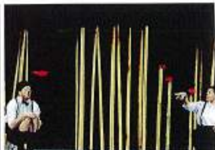
I protagonisti di "Abbrocci" (11 novembre)