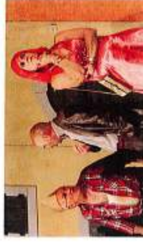
La commedia in dialetto veneto "Contiere o luci rosse"

Di sicura presa sul pubblico sono i titoli in cartellone nell'annuale Concorso Nazionale del Teatro Dialettale Stefano Fait in corso di svolgimento al Teatro dei Filodrammatici di Laives: Filomeno Morturo di Eduardo De Filippo è una donna matura, con un passato da prostituta, che si finge morbonda per farsi sposare da un impenitente donnaiolo, fino a quando subentra un drastico e improvviso cambiamento di rotta; l'esibizione in dialetto napoletano del Gruppo Teatrale Vullimmi Vullà è fissata per il 12 gennaio h. 20.45, Contiere o luci