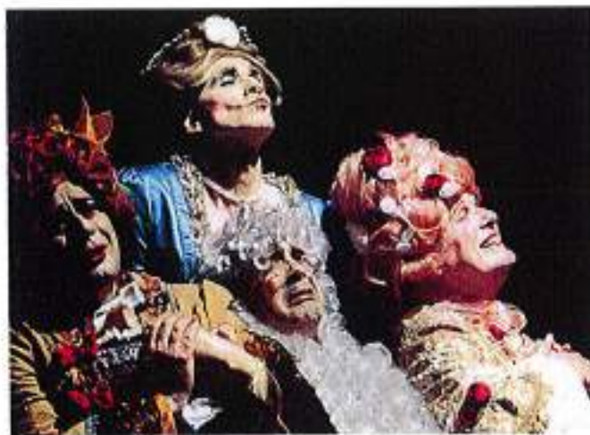
"Quei fremiti d'amor" (3 novembre a Laives)