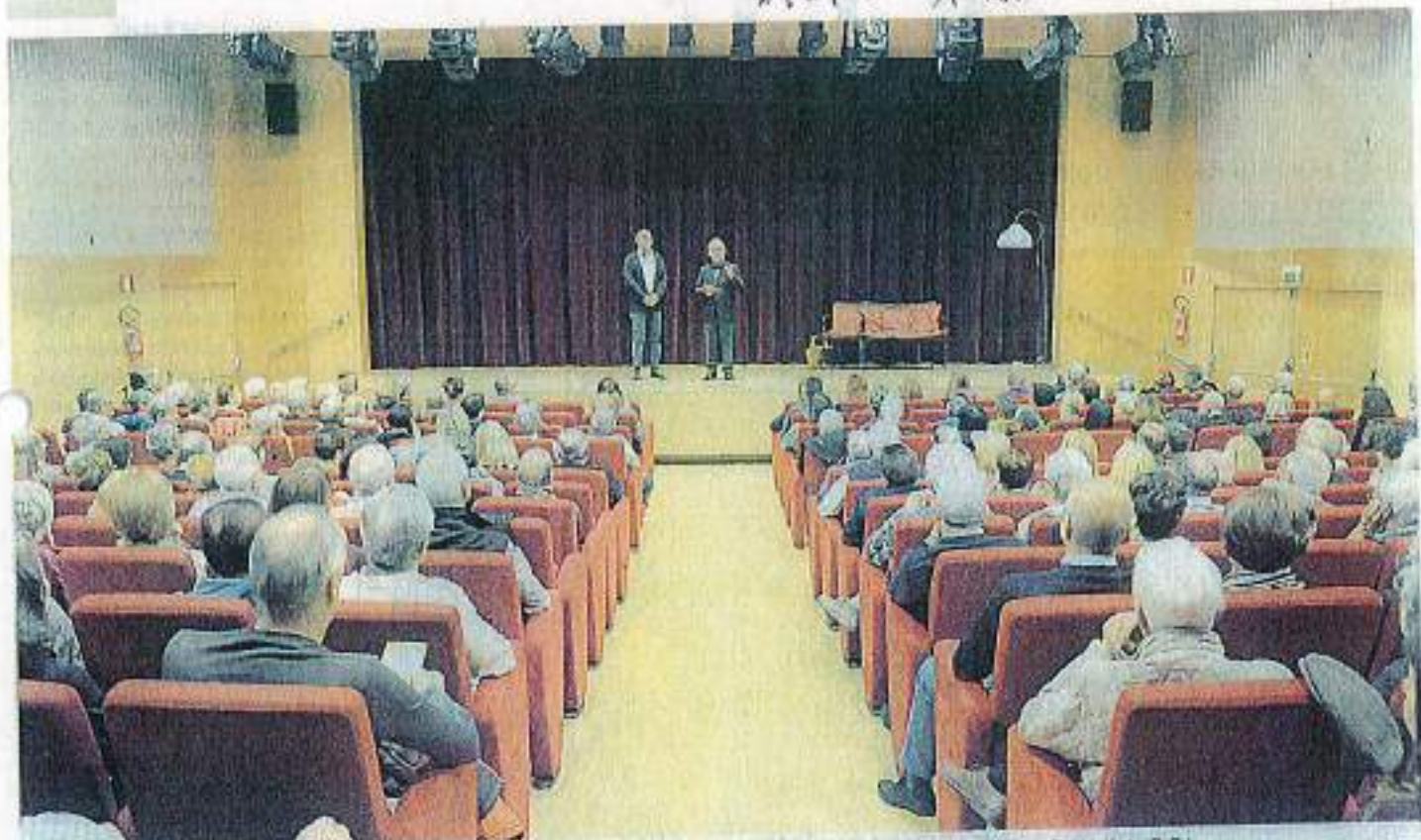
La sala del teatro «Gino Coseri», dove è in programma la 44ª rassegna nazionale di teatro dialettale «Stefano Faiti»