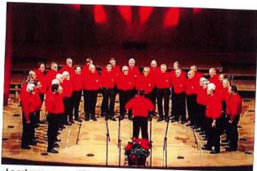
• La colonna sonora affidata al coro Monti pallidi

LAIVES. Venerdì 20 ottobre prende il via la 44esima edizione della rassegna nazionale di teatro dialettale "Stefano Fait", alla sala del teatro Gino Coseri a Laives; la partenza è subito "col botto". Lo spettacolo proposto (inizio alle 20.45) sarà "Il fremito dell'alba", che vedrà esibirsi la Filodrammatica di Laives, organizzatrice della rassegna accanto al coro Monti pallidi che garantirà la colonna sonora ai racconti tratti dai testi scritti da Mario Rigoni Stern. Info e biglietti 0471-952650.