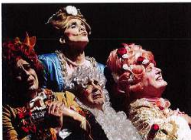
"Quel fremito d'amor" (3 novembre a Laves)