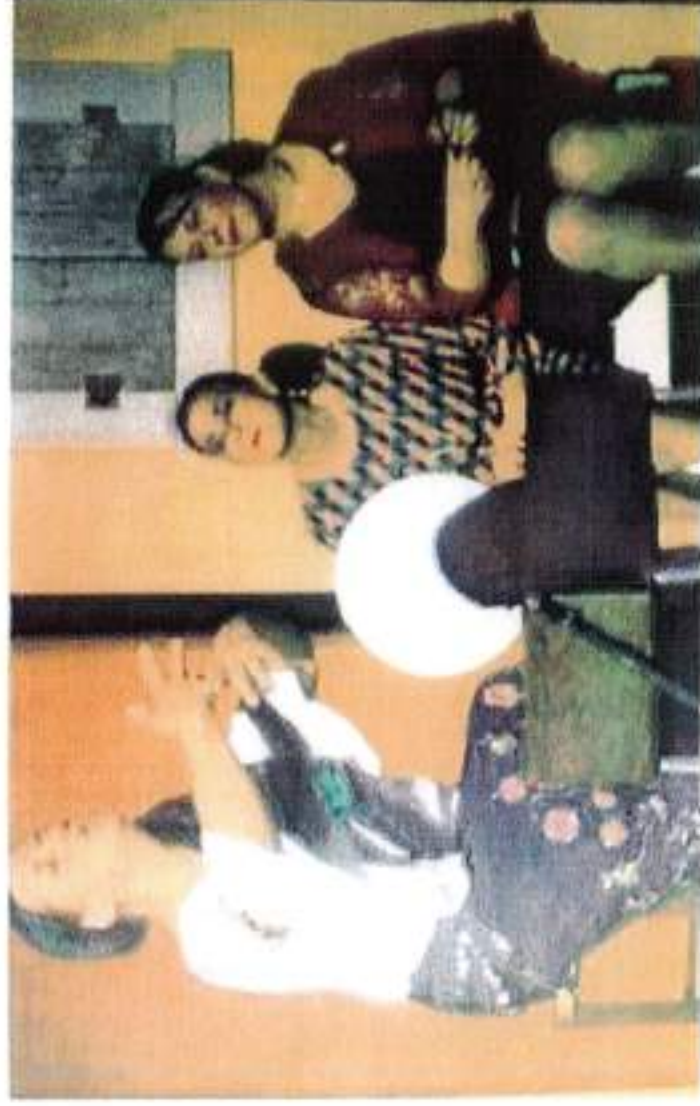
• In scena al Coseri il teatro in dialetto veronese

LAVES. Con la commedia in dialetto veronese "Cantiere a luci rosse", venerdì 26 gennaio (inizio 20.45), torna la rassegna nazionale di teatro dialettale nella sala "Gino Coseri" di Laives. In scena sarà il Gruppo teatrale Amici teatro dell'Attorchio, di Cavaion Veronese. Attorno ad un impresario edile e ai suoi dipendenti, ruota una girandola di personaggi della brillante commedia. I biglietti sono in vendita all'ufficio della Filodrammatica di Laives (0471-952650) o www.teatro-filolaves.it/biglietti .