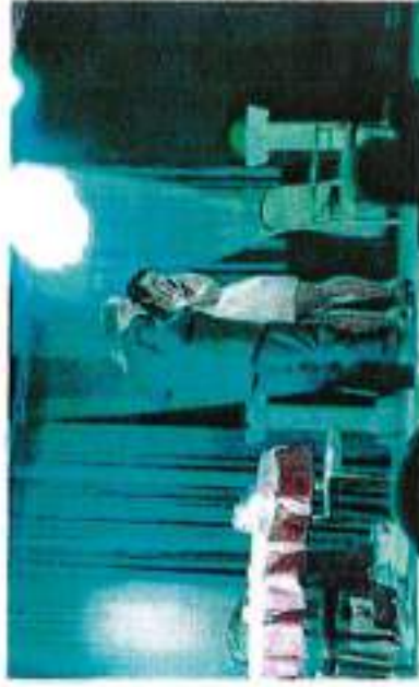
• Il gruppo teatrale Vulimm' Vuilà in scena al Teatro Cosetti di Laives

colare il mimo è ricreato con sorprendente plasticità quando i giovanissimi attori (che interpretano i figli della Marturano) riproducono sinuose movenze che in una sintesi visuale appaiono come fisici prolungamenti, quasi tentacoli di corpi che si tengono uniti nel loro insieme, a suggello della volontà della madre di annullare tra loro qualsiasi differenza.