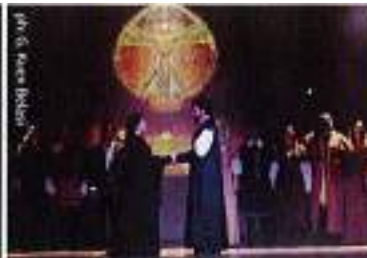
Il musical "Da Vinci by Lisa" (25/11)