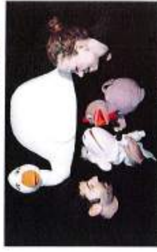
Per bambini: "Il brutto anatroccolo" al Teatro Cristallo