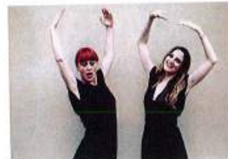
"Mammadimerdalive" (30 novembre)