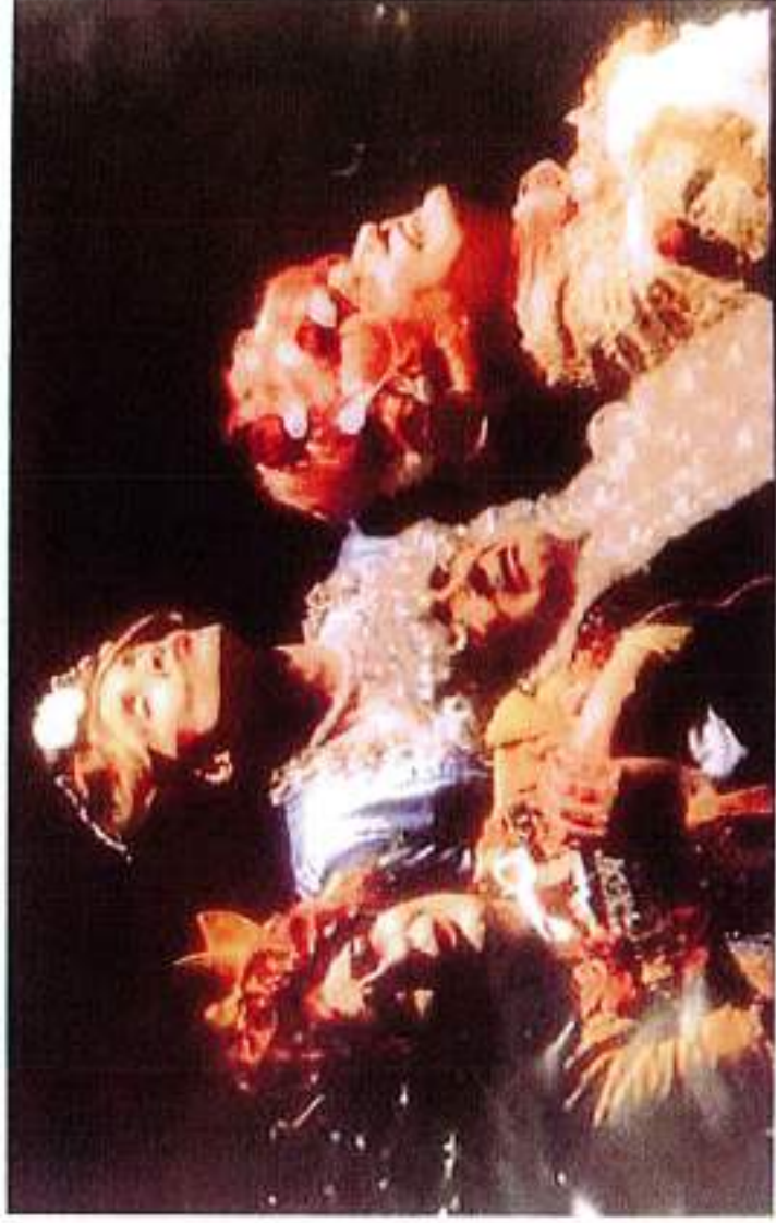
• In scena al Coseri il "Teatro dei pazzi"

Informazioni e prenotazioni allo 0471-952650 o online www.teatrofilolaives.it/biglietti o www.teatrodellemusepineta.it/prenotazione biglietti.