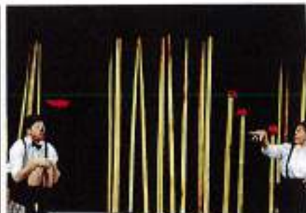
I protagonisti di "Abbrocci" (11 novembre)