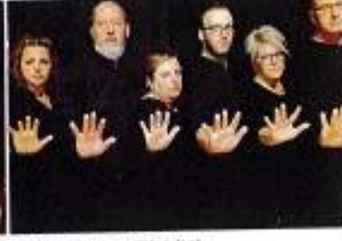
"Noi diciamo no!" (19/11)

tro Puccini di Merano il giorno 9 h. 20.30; al Forum di Bressanone l'11 h. 20.30). Si presenta piuttosto intrigante Tipi umani seduti al chiuso , un progetto di Lucia Calamaro che si sofferma sui frequentatori di biblioteche, con i loro sentimenti, gioie e frustrazioni (Teatro Cristallo, 20 novembre h. 20.30 e in replica al Teatro Puccini di Merano il giorno 22 h. 20.30).