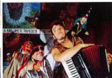
"Fagiolino asino d'oro" (19 novembre)