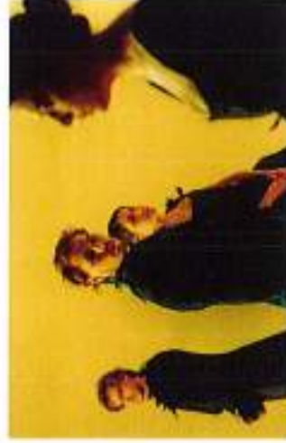
Una scena de "Gli innamorati" di Carlo Goldoni

dignità artistica (6 gennaio h. 15.30). Segue il brutto anatroccolo che, nella storia animata della compagnia Proscenio Teatro, è diventato grande, si è affermato come Capitano di Marina impegnato a salvare altri brutti anatroccoli scappati da fattorie, esattamente