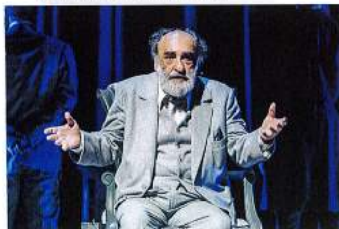
Alessandro Haber in "La coscienza di Zeno" (9-12 novembre)