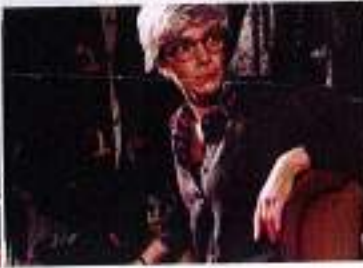
"Risi e bisì" (5/11)