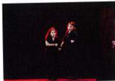
"I dialoghi della vagina" (23 novembre)

Prosegue al Teatro Gino Coseri di Lalves la 44ª edizione del Concorso Nazionale del Teatro Dialettale Stefano Fait con due spettacoli: Quel fremito d'amor,