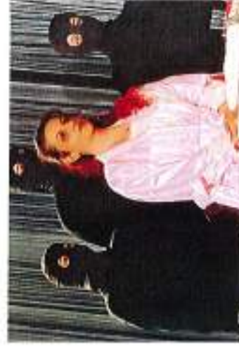
Un capolavoro di E. De Filippo: "Filomena Morturo"

rosse è una commedia brillante in dialetto veronese firmata da Igino Dalle Vedove e affidata alla compagnia Amici del Teatro dell'Atorchio; due operai stanno lavorando nel cantiere di un ingenuo impresario che intende ristrutturare un appartamento dal regalare alla sua amante, con l'ensia di essere scoperto dalla moglie (16 gennaio h. 20.45).