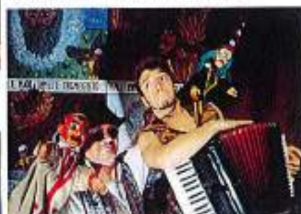
"Fagiolino asino d'oro" (19 novembre)