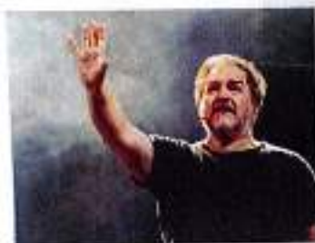
"Da qui alla luna" (7-8-9-11/11)

Mese ricco di grandi spettacoli e interpreti in tutta la provincia